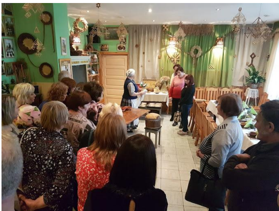
13. Kopš Maizes muzeja atvēršanas tūristu skaits no Latvijas, Lietuvas, Igaunijas, Somijas Polijas, Zviedrijas, Anglijas u.c. pieaug un gadā jau krietni pārsniedz 13 tūkstošus, un katrs nobauda šķēli maizes veistūklā.