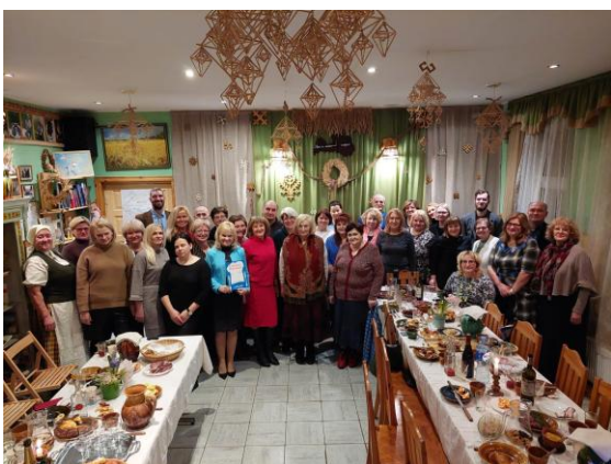
14. Biedrības “Latgales Kulinārā mantojuma centrs” biedriem un viesiem – skolotājiem no Rīgas Tūrisma un radošās industrijas, Ogres un Kuldīgas Tehnoloģiju un tūrisma tehnikumiem bija iespēja izbaudīt Latgales īpašos ēdienus, arī maizes veistūkli.