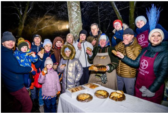
12. Aglonas maizes veistūklis bagātina Latgalē svinētos gadskārtas svētkus. Attēlā: Meteņdiena Daugavpilī 2023.g. janvāris.