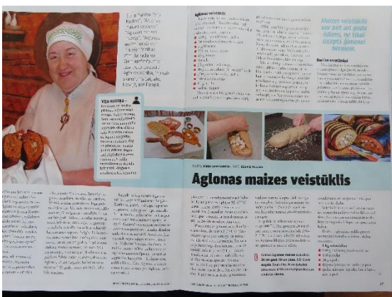
19. Raksts "Aglonas maizes veistūklis.", žurnāls "Praktiskais Latvietis", 2023., NR.12.